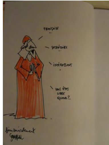
Séance de dédicace à l'issue de la réunion